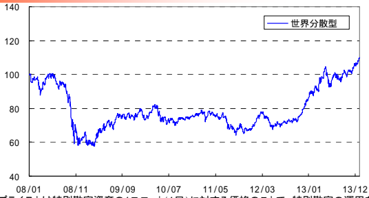
ユニット・プライスとは特別勘定資産の1ユニット(1口)に対する価格のことで、特別勘定の運用を開始した時点をもとに100として指数化したものです。