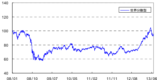
ユニット・プライスは特別勘定資産の1ユニット(1口)に対する価格のことで、特別勘定の運用を開始した時点をもとに100として指数化したものです。