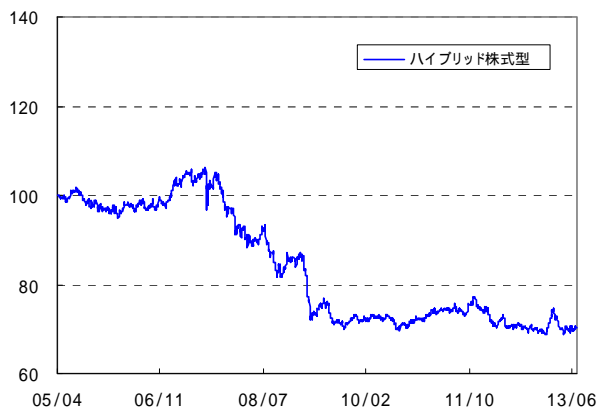
ユニット・プライスとは特別勘定資産の1ユニット(1口)に対する価格のことで、特別勘定の運用を開始した時点を「100」として指数化したものです。