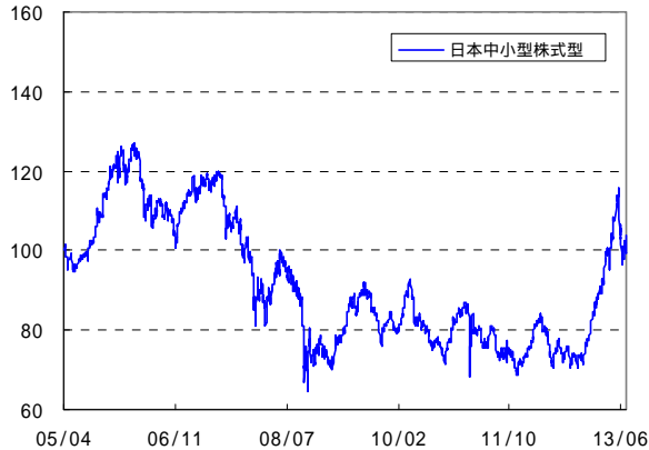
ユニット・プライスとは特別勘定資産の1ユニット(1口)に対する価格のことで、特別勘定の運用を開始した時点(100)として指数化したものです。