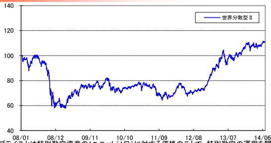
※ユニット・プライスは特別勘定資産の1ユニット(1口)に対する価格のことで、特別勘定の運用を開始した時点をも「100」として指数化したものです。