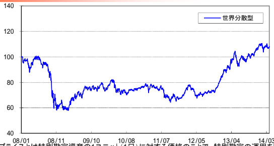
ユニット・プライスとは特別勘定資産の1ユニット(1口)に対する価格のことで、特別勘定の運用を開始した時点をもとに100として指数化したものです。