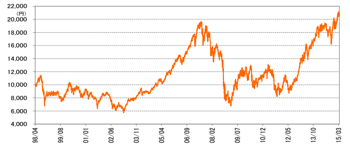
基準価額の推移 [設定日:1998年4月1日] (2015年3月末現在)