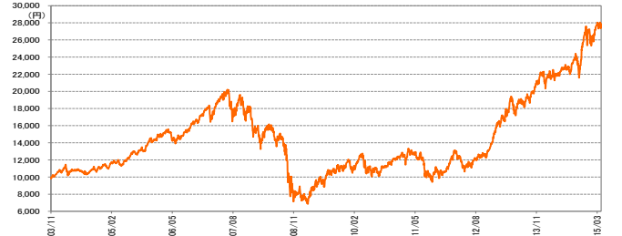
基準価額の推移 [設定日:2003年11月18日] (2015年3月末現在)