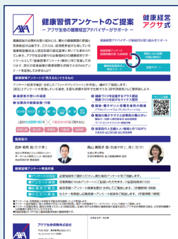
健康習慣アンケート 案内文イメージ

健康習慣に関するアンケートを行い、アンケートから明らかになった健康課題を見える化し、健康経営の視点からアドバイスを行います。アンケート結果については「健康習慣アンケート Feedback Sheet」を作成し回答いただいた企業にご報告いたします。