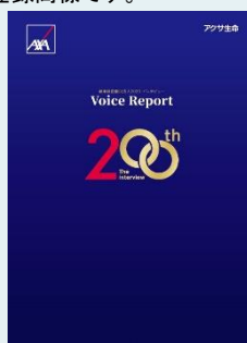
健康経営優良法人2020 インタビュー Voice Report 200th